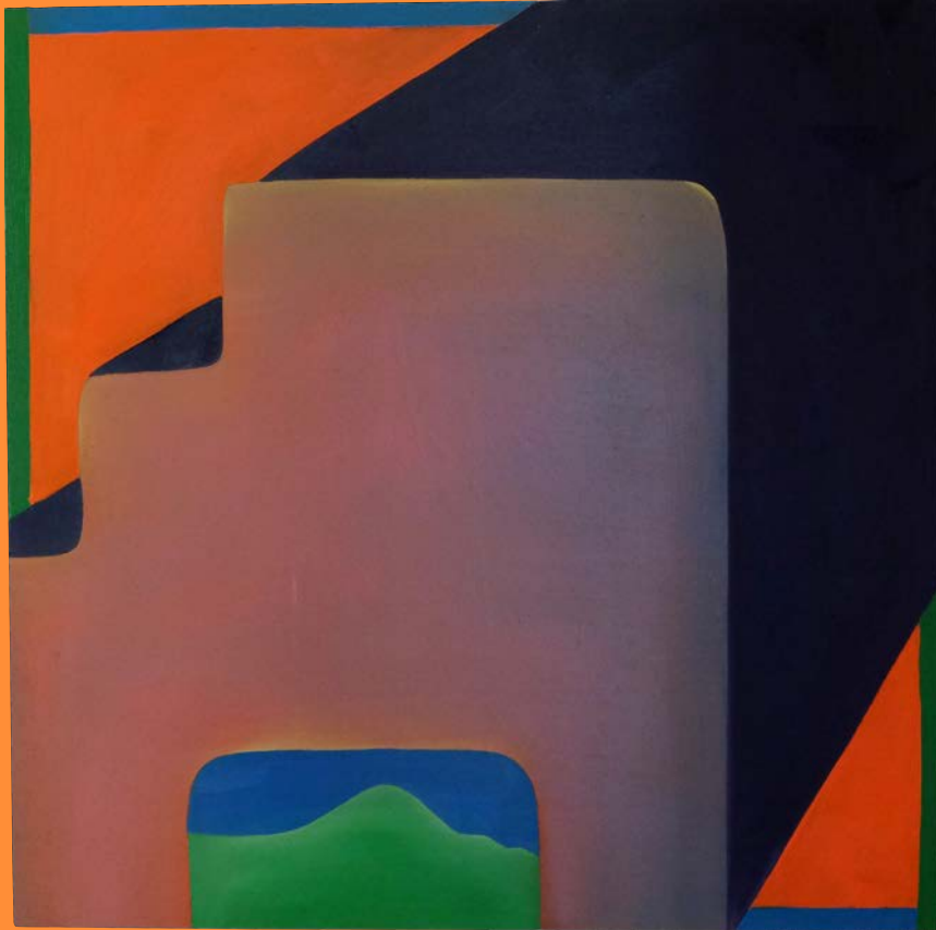
Welcome, 2020 30 x 30 cm, Öl auf Holz