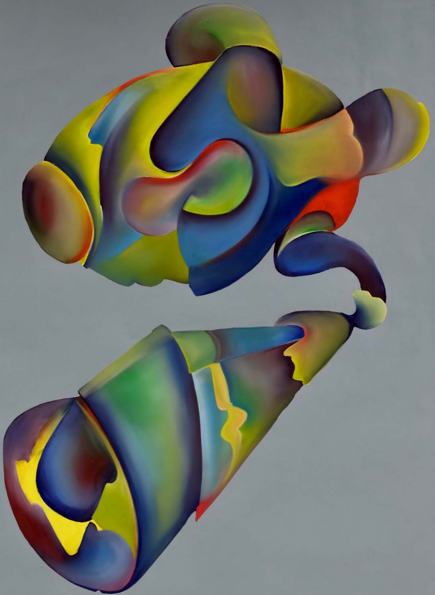
Ohne Titel , 2018 94 x 65cm, Öl auf Papier