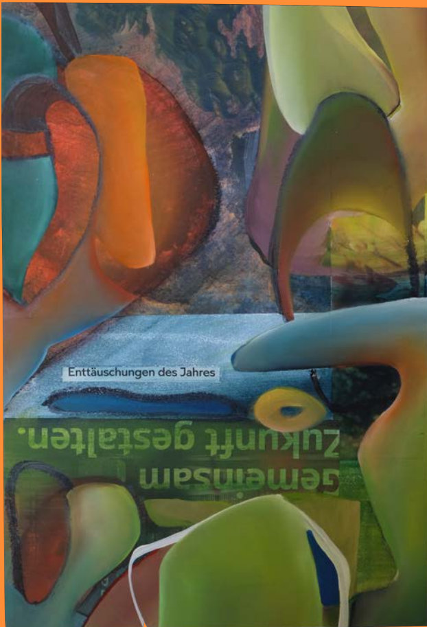
Enttäuschungen des Jahres , 2019 25 x 33.5cm, Collage, Öl auf Papier