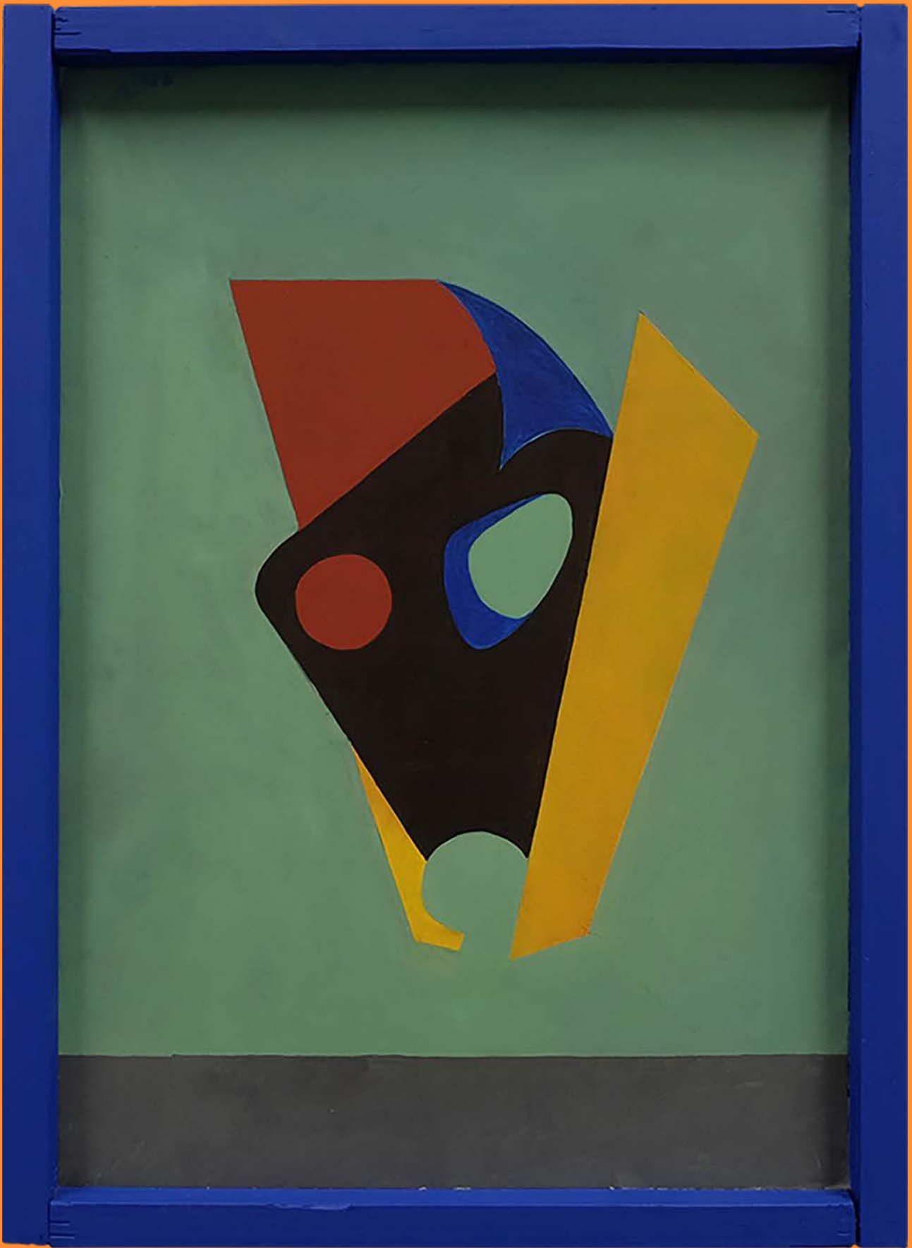
Ein unbeliebtes Schwebobjekt, 2019 30 x 45cm, Öl auf Karton, Acryl auf Holz, Holzleim