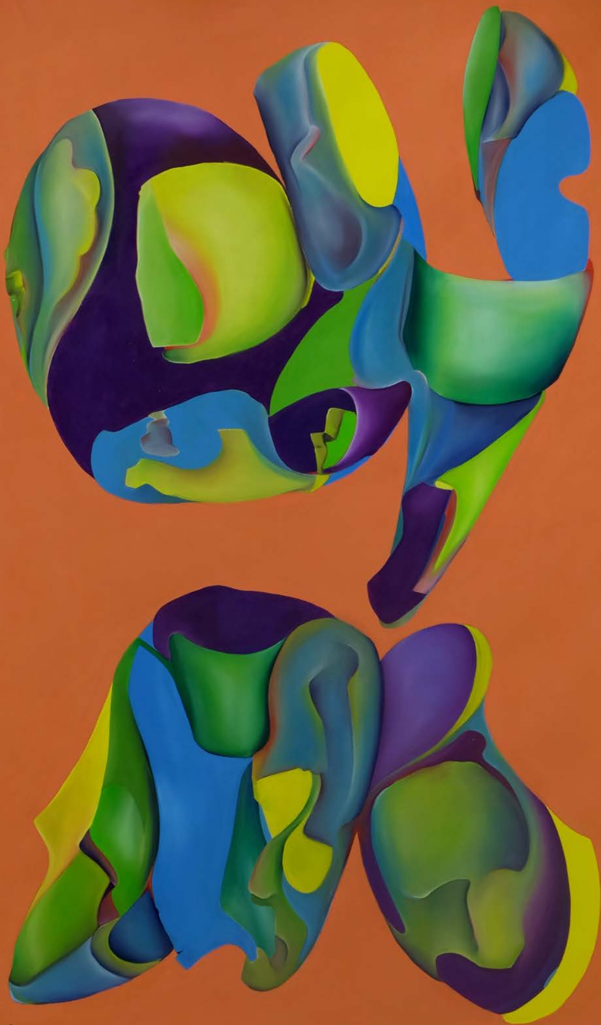
Ohne Titel , 2018 94 x 65cm, Öl auf Papier