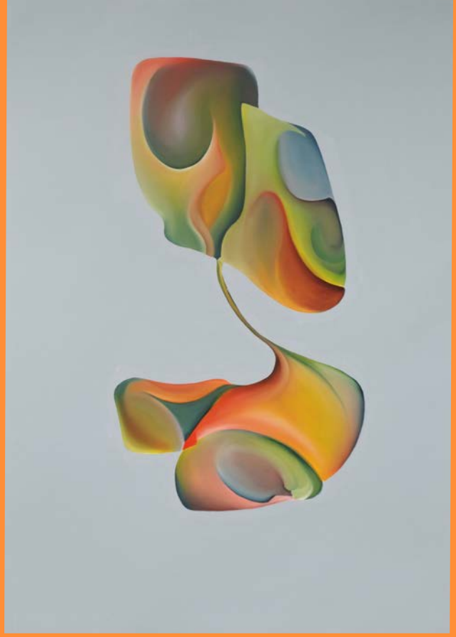
Ohne Titel, 2017/18 67.5 x 48cm, Öl auf Papier