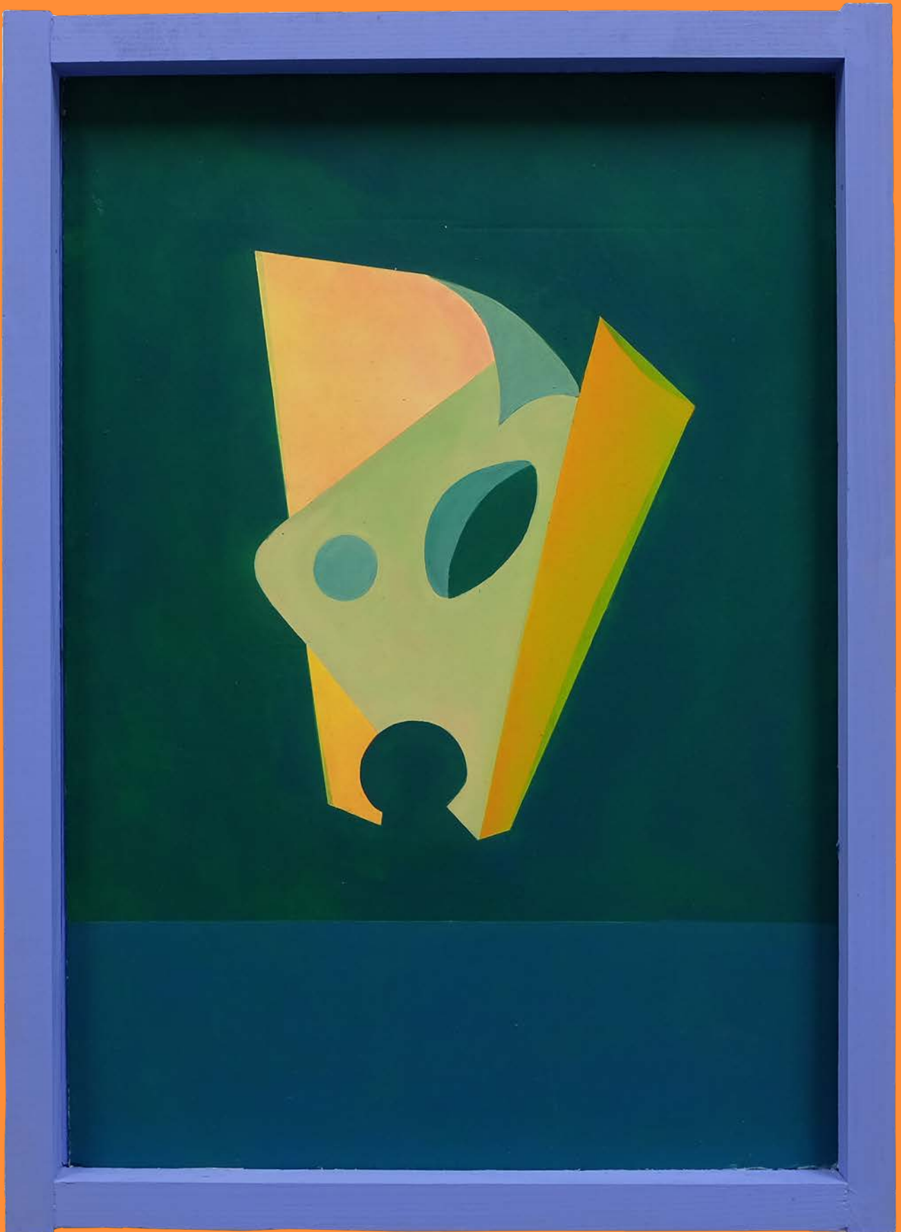
Ein unglaubliches Schwebobjekt, 2019 30 x 45cm, Öl auf Karton, Acryl auf Holz, Holzleim