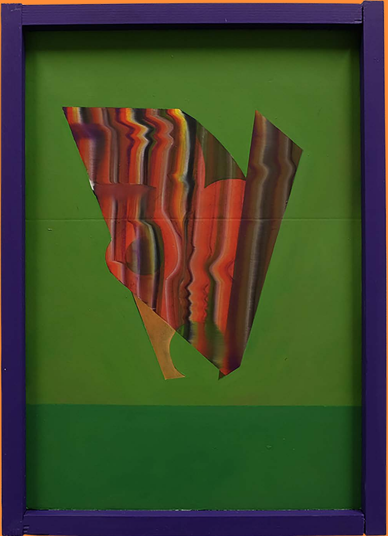
Ein unzerstörbares Schwebobjekt, 2019 30 x 45cm, Öl auf Karton, Acryl auf Holz, Holzleim