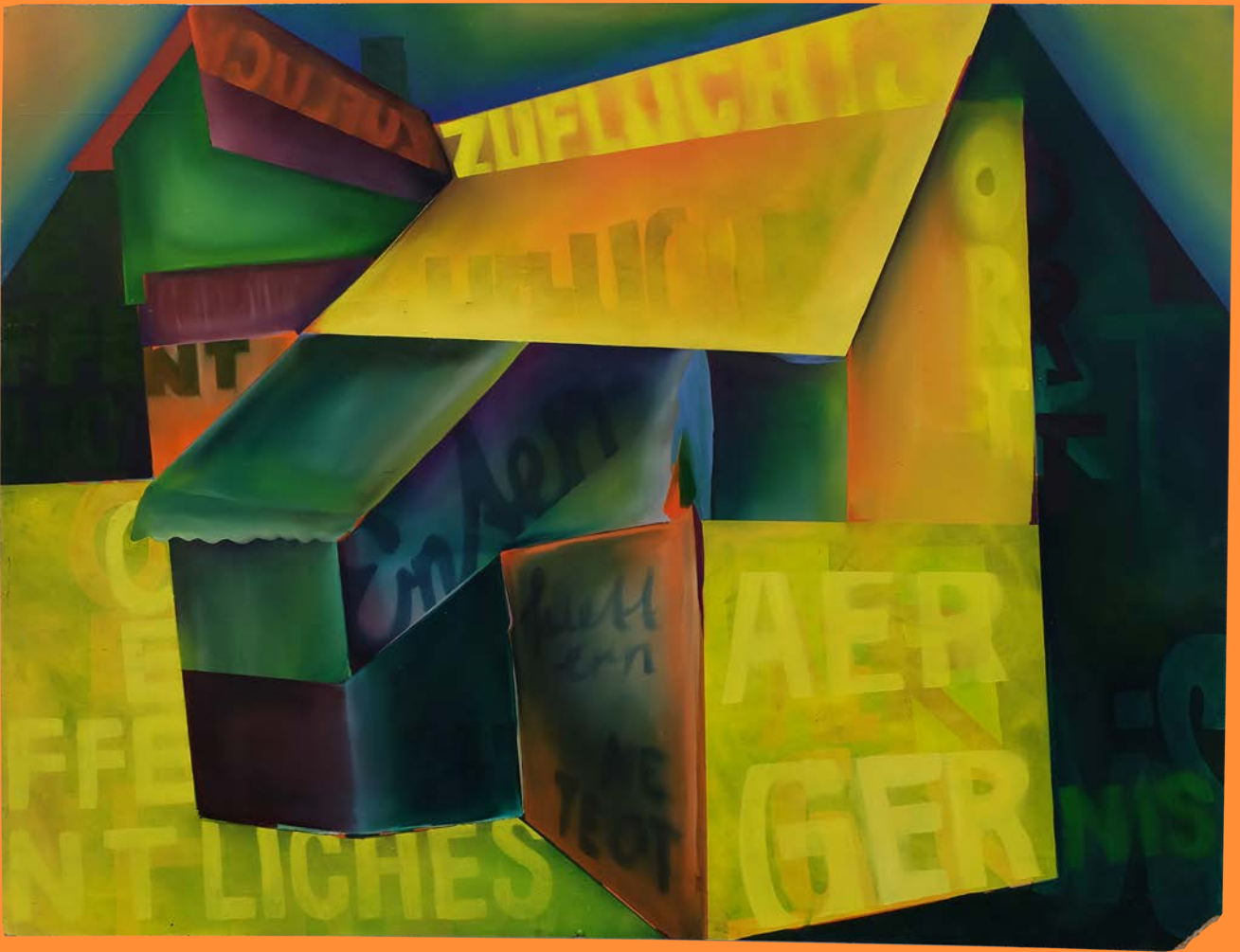
ENTENFUETTERN/ENTENTOETEN, 2018 130 x 100cm, Öl auf Holz