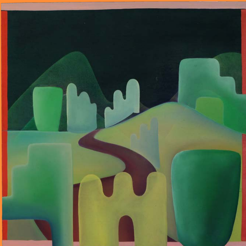
Die Gesteinsmasse, schimmernd in bunten Grautönen , 2020 30 x 30 cm, Öl auf Holz