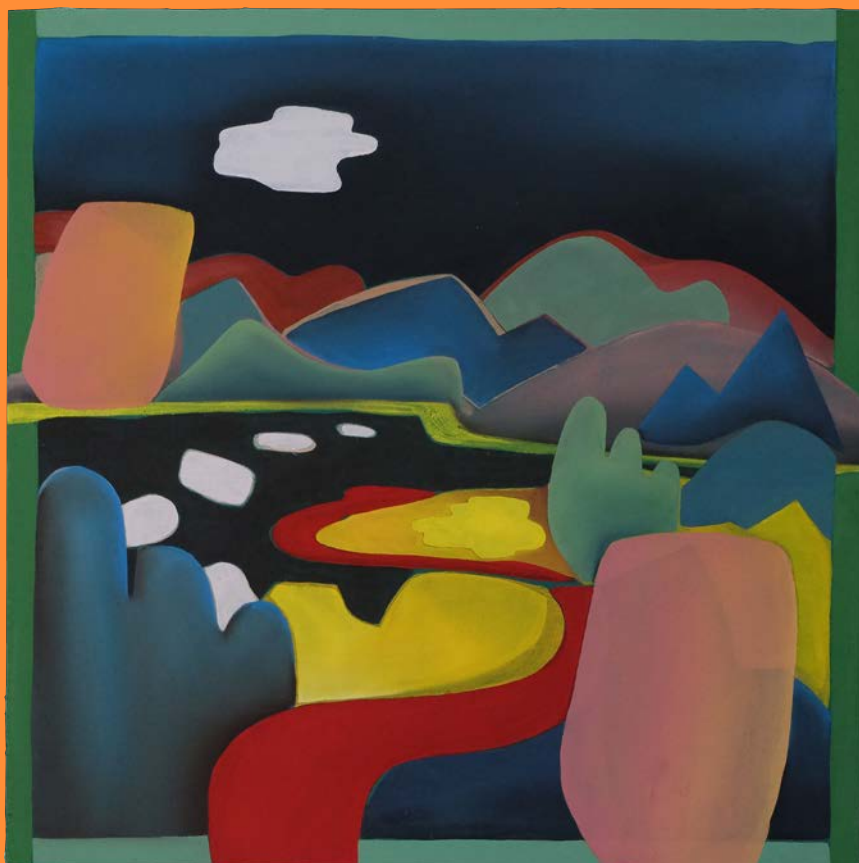
extremely warm, 2020 30 x 30 cm, Öl auf Holz