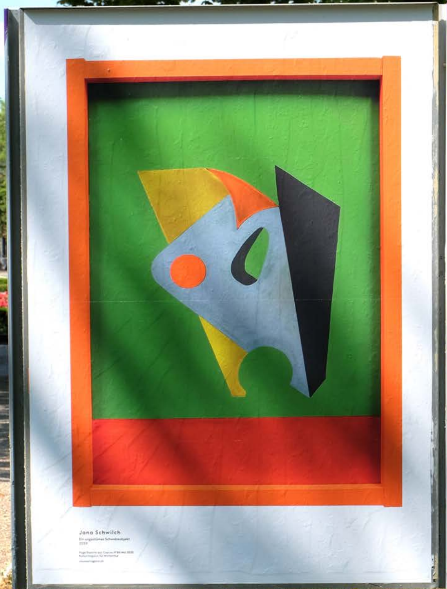
Ein ungestümes Schwebobjekt, 2019 Druck, 90.5 x 128cm

Ausstellungsansicht: Kunst am Plakat, 2020 Freiluft-Gruppenausstellung, Winterthur