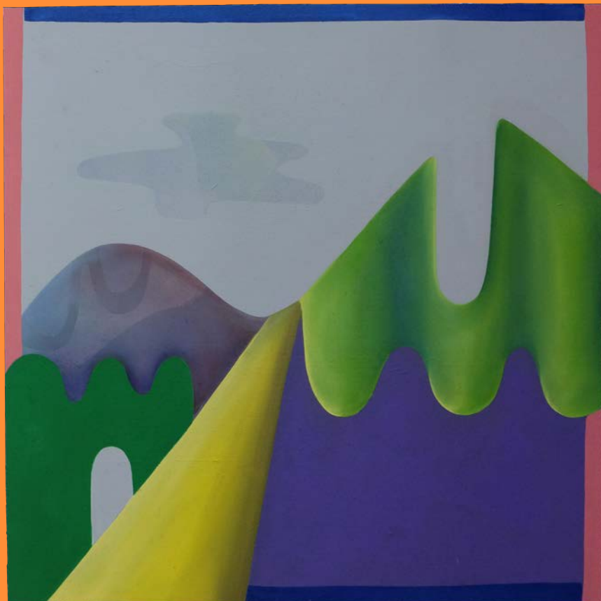
glatt und sauber, 2020 30 x 30 cm, Öl auf Holz