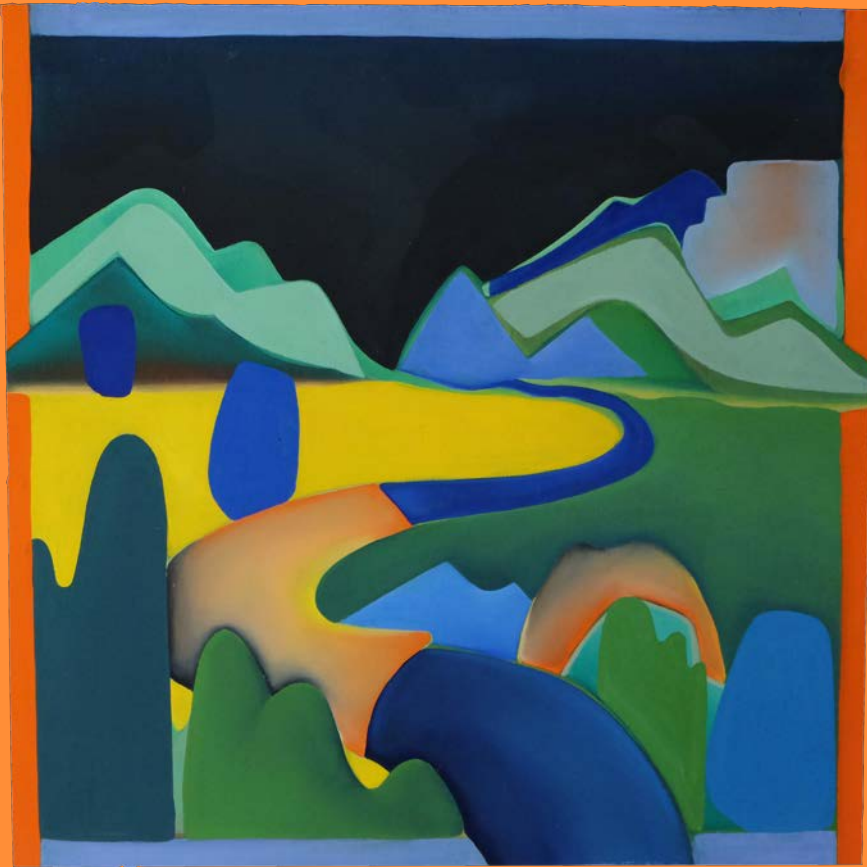
no temperature, 2020 30 x 30 cm, Öl auf Holz