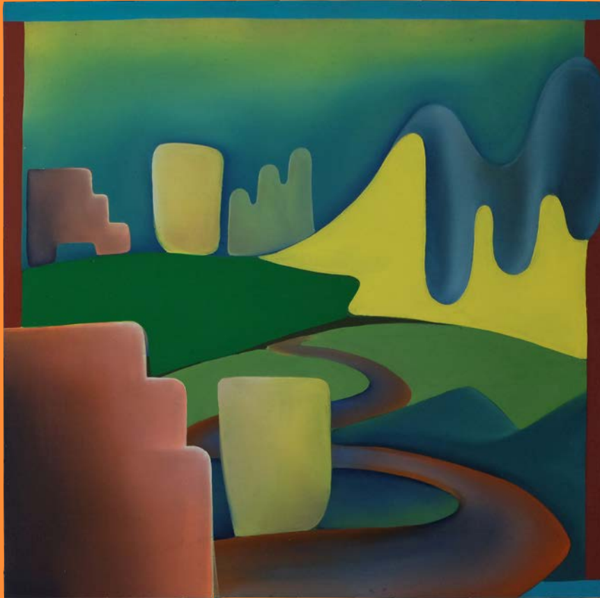
Talking in Code , 2020 30 x 30 cm, Öl auf Holz