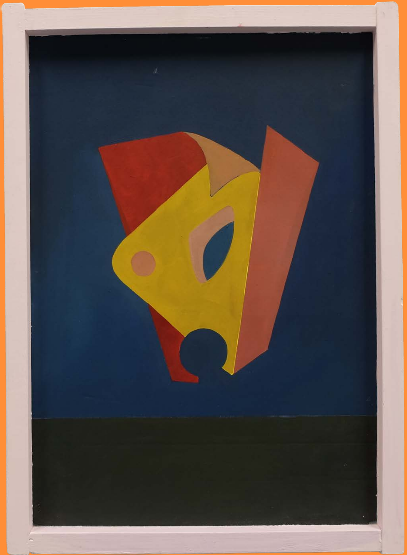
Ein unsicheres Schwebobjekt, 2019 30 x 45cm, Öl auf Karton, Acryl auf Holz, Holzleim