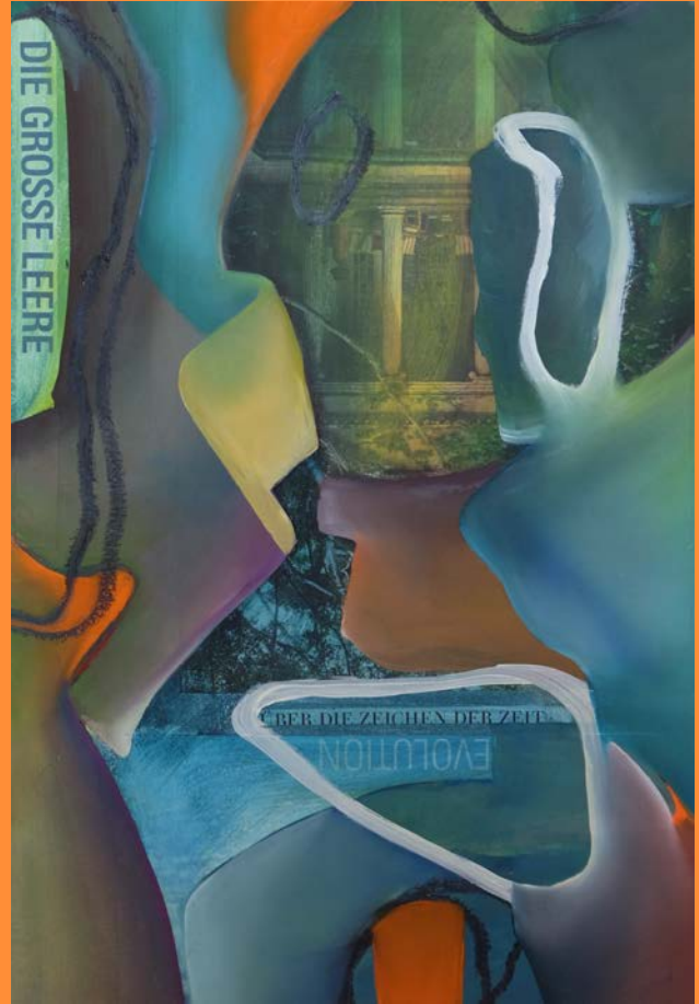
Die grosse Leere , 2019 25 x 33.5cm, Collage, Öl auf Papier