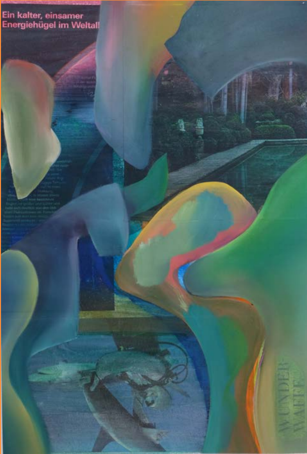
Ein kalter, einsamer Energiehügel , 2019 25 x 33.5cm, Collage, Öl auf Papier