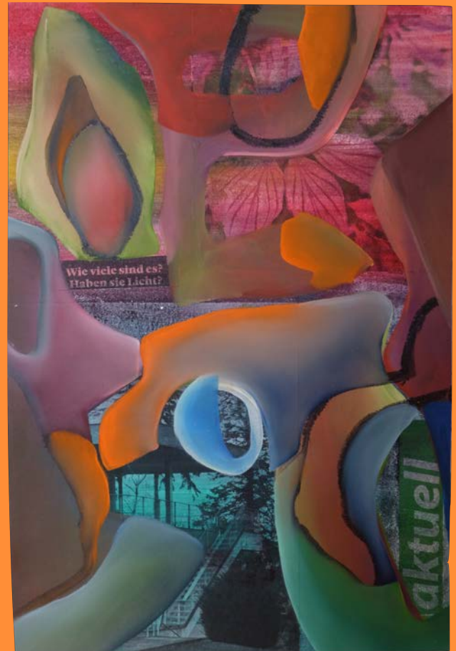
Wie viele sind es? , 2019 25 x 33.5cm, Collage, Öl auf Papier