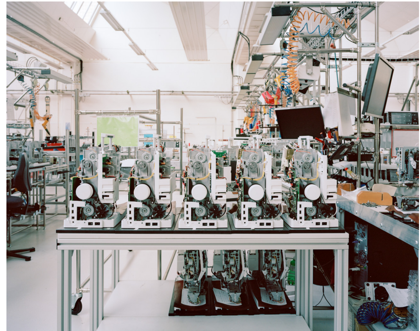
Montage, BERNINA Fritz Gegauf AG, 2015