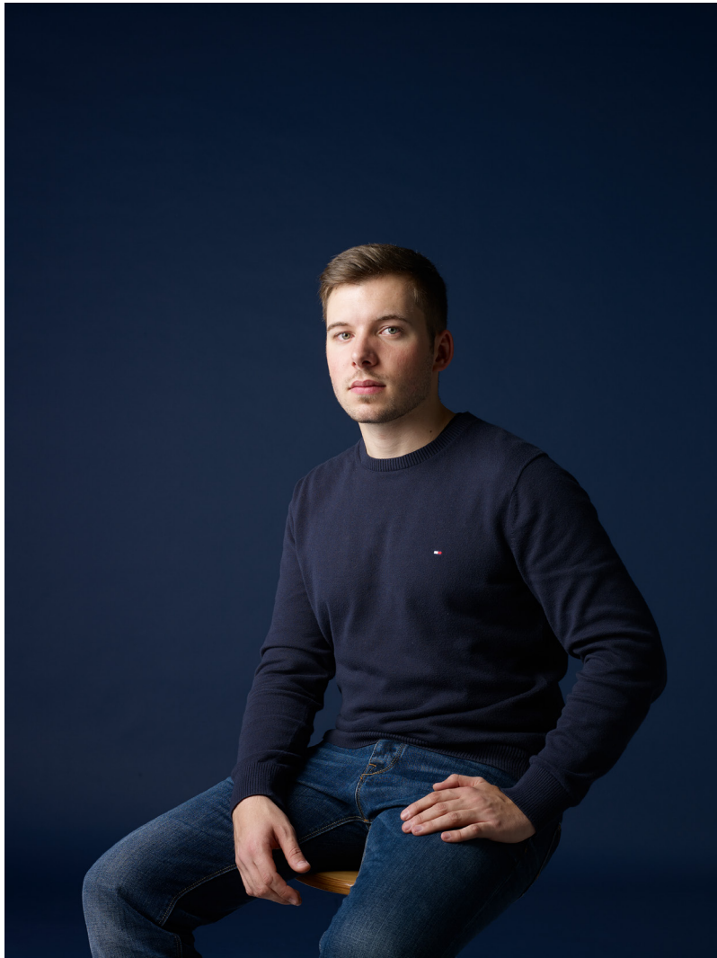
Julius I, 2015 40cm x 30cm