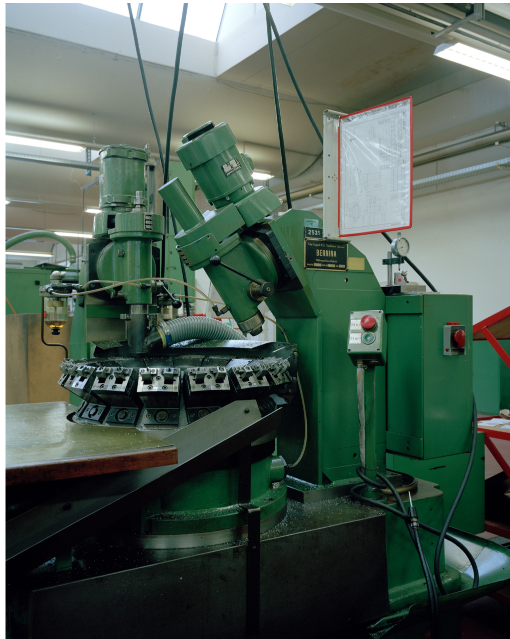
Maschine No. 64069 / Baujahr 1979 Abteilung Flex-Tec, BERNINA Fritz Gegauf AG, 2015