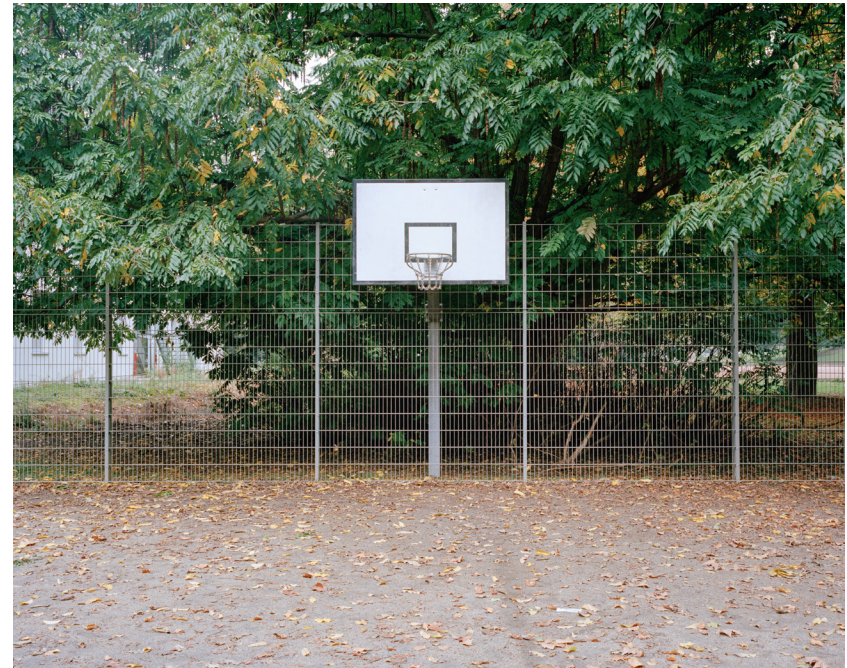
Hälften II, 2015 60cm x 75cm