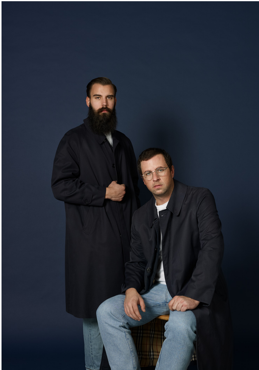
Rupp / Stebler, 2015 80cm x 60cm