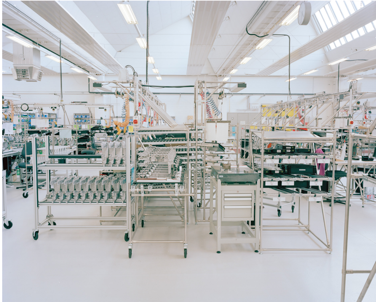
Montage, BERNINA Fritz Gegauf AG, 2015