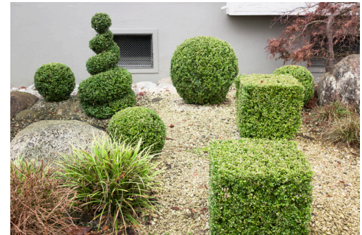
Buxus Helveticus, 2014 60cm x 80cm