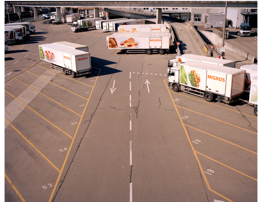
Ohne Titel, 2014 88cm x 110cm