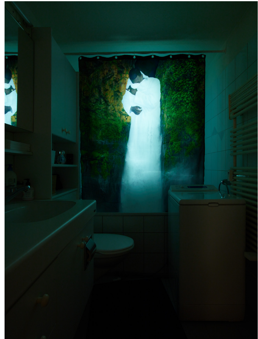
Gucci everything II, 2015