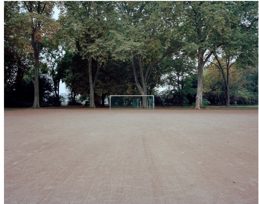
Hälften I, 2015 60cm x 75cm