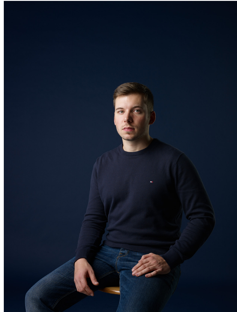
Julius II, 2015 40cm x 30cm