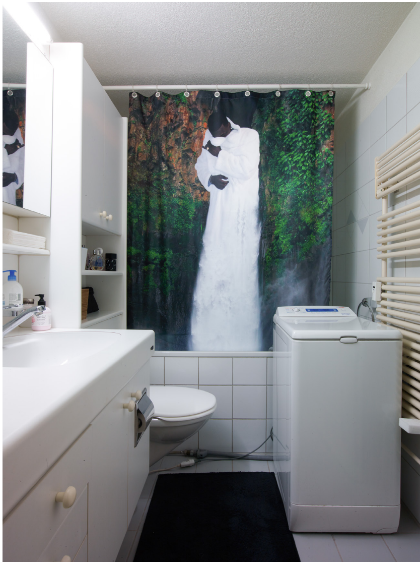
Gucci everything I, 2015