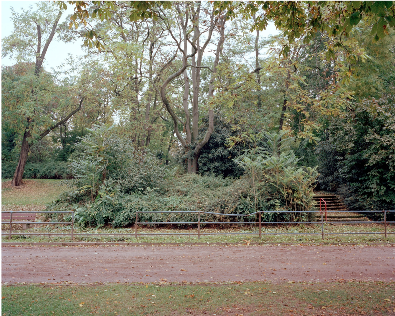
Paradies , 2015