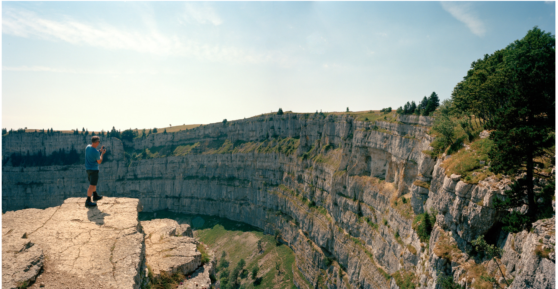
Creux du Van, 2015 80cm x 160cm