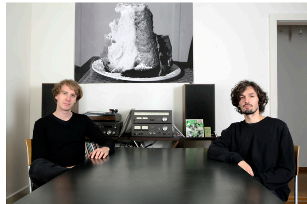
Nachbarn / Neighbours / sąsiedzi, 2015