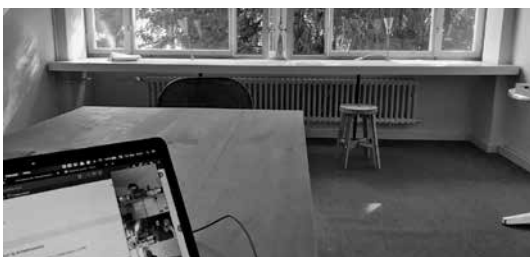
Ein Blick hinter die Kamera: Orte der #smartsetting-Teilnahme.

als offene Lehrveranstaltung im Herbst durchgeführt wurde. Über den Kurs hinweg haben rund 20 Personen per Videokonferenz oder vor Ort an der ZHdK teilgenommen. Die Teilnehmenden haben eine eigene Fragestellung eingebracht und diese in einem offenen Prozess entwickelt: https://paul.zhdk.ch/smartsetting .