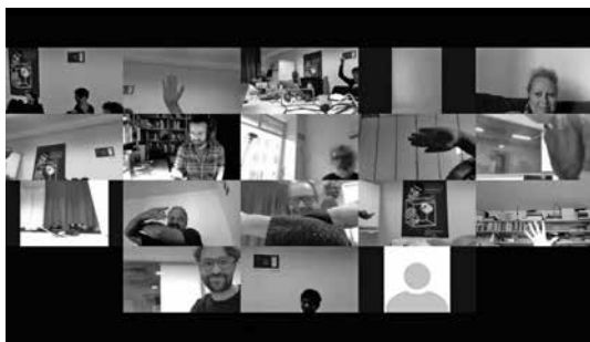
Gemeinsam Rapport definieren (Bild: Screenshot aus der Session 1).

Eine grundlegend andere Herangehensweise ist die Haltung «Commitment without Binding 2 ». Mit «unverbindlichem Engagement» beschreibt Stefan Seydel (2019), dass Online-Kollaboration andere Paradigmen mit sich bringen kann: Teilnehmende sollen sich nicht zeitlich verpflichten; auch wenn sie nur zu einem einzigen Zeitpunkt das Vorhaben voranbringen. Sei es durch einen Input oder eine Rückmeldung, sei dies als Gewinn an der Sache zu werten. Wie dieses Commitment in Online-Kursen und Videokonferenzen als Chance genutzt werden kann, ist eine spannende Fragestellung, die uns auch weiterhin begleitet.