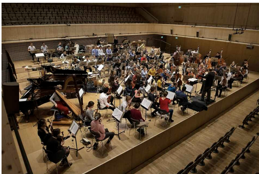
Orchester der ZHdK